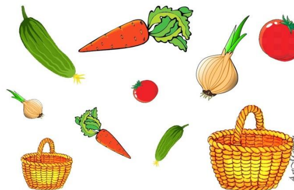
Сложи большие овощи в большую корзинку, а маленькие – в маленькую.