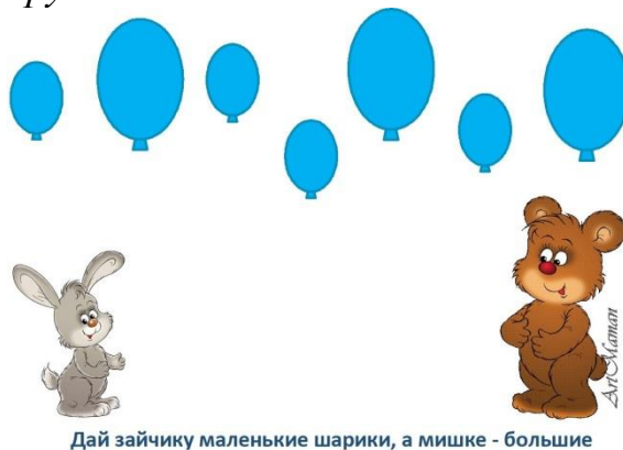
Дай зайчику маленькие шарики, а мишке - большие

Зайчику нужно дать маленькие шарики, а мишке - большие. Можно рисовать "ниточки" у маленьких шариков одним цветом, а у больших - другим.