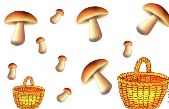
Сложи большие грибы в большую корзинку, а маленькие – в маленькую.

Разложить грибочки (овощи) по корзинкам: большие - в большую корзинку, а маленькие - в маленькую, соединяя их линиями. Можно взять разные карандаши и "собирать" большие грибы (овощи) одним цветом, а маленькие - другим.